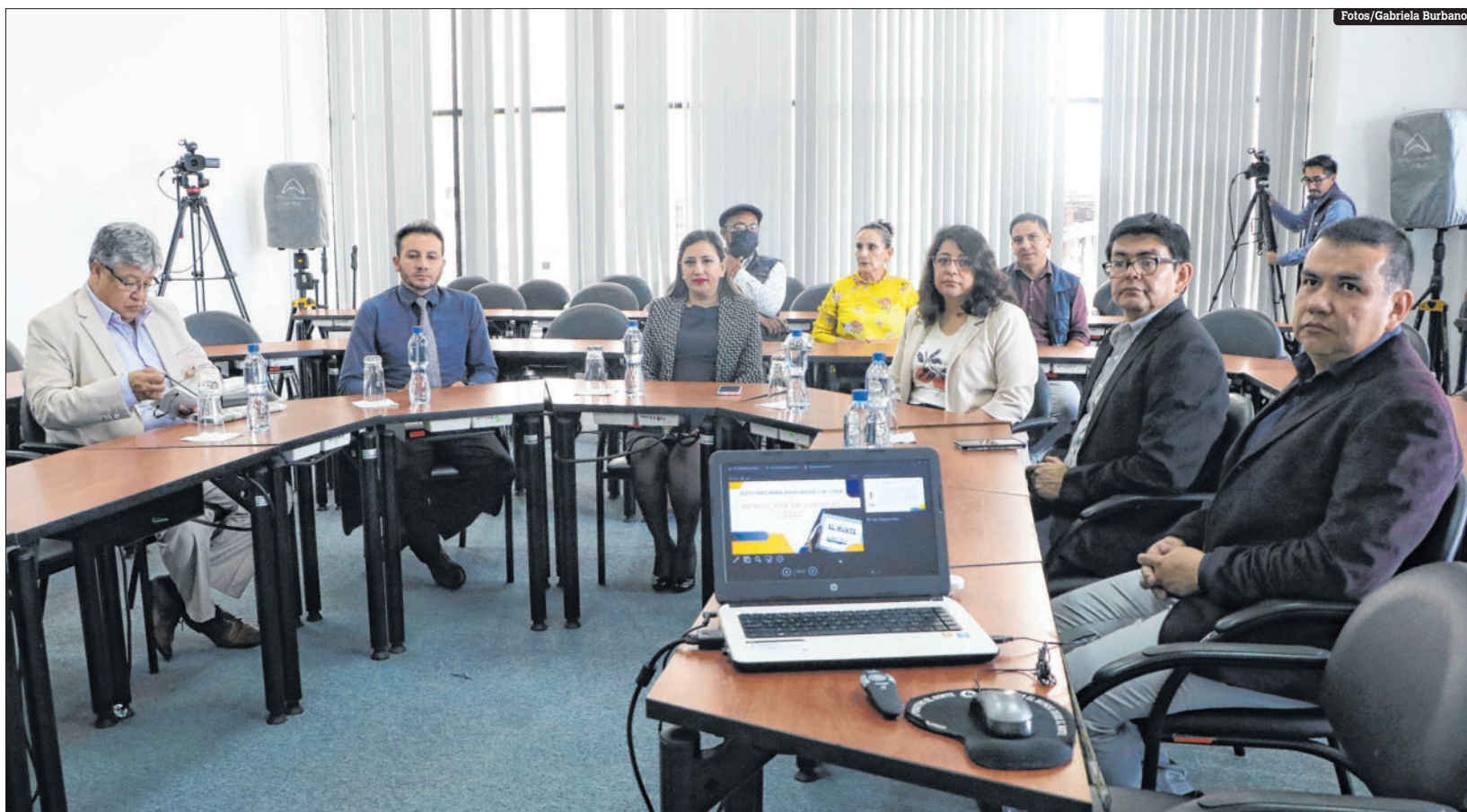
La mesa directiva de las autoridades y representantes de Grupo Corporativo EL NORTE, durante su rendición de cuentas realizada en el centro de Ibarra

El equipo humano que trabaja en GCN está conformado por 35 trabajadores, de los cuales el 54% son mujeres y el 46% hombres.