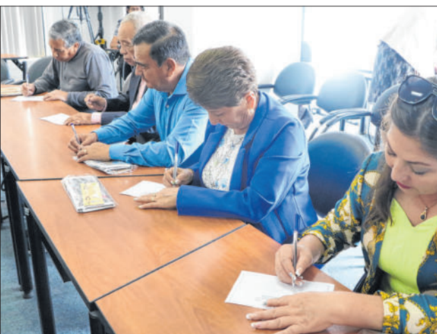
Los asistentes realizaron recomendaciones a las diferentes áreas que componen el Grupo Corporativo EL NORTE